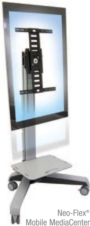
Neo-Flex® Mobile MediaCenter